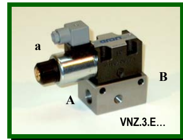
Alaphelyzetben zárt útváltó